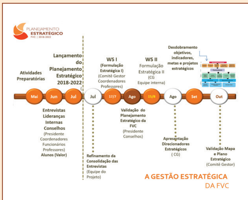
Figura 02: Linha do tempo

Participaram do processo 81 pessoas entre direção, gestores, professores e técnicos.